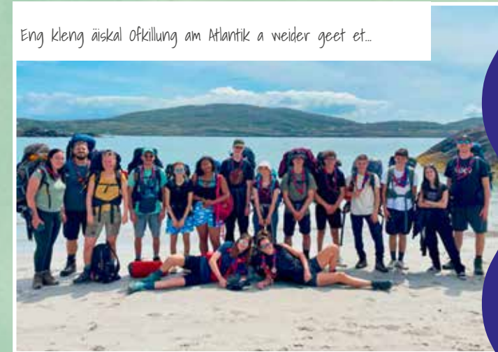
Eng kleng äiskal Ofkilling am Atlantik a weider geet et...