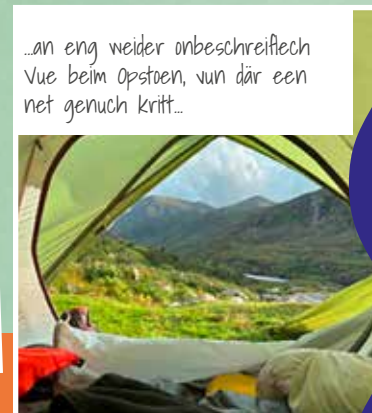
...an eng weider unbeschreiblech Vue beim Opstoan, vun där een net genuch kritt...