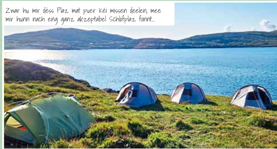
Zwar hu mir dëss Plaz mat puer Kéi missen deelen, mee mir hunn nach eng ganz akzeptabel Schlafplaz fonnt...