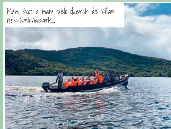
Mam Boot a mam Vëlo duerch de Killarney-Nationalpark...