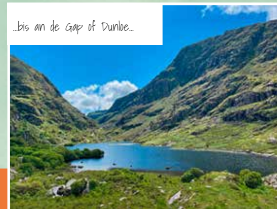
...bis an de Gap of Dunloe...