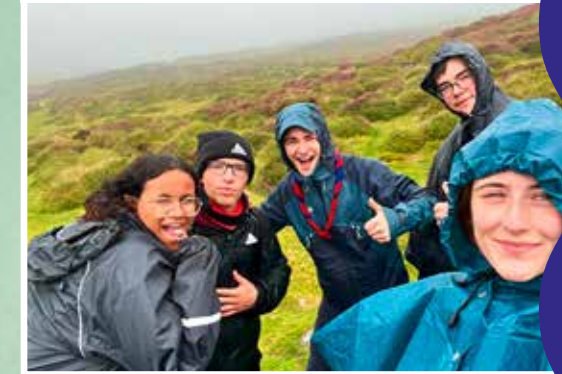
Den Dingleway ass ee vun deene schéinsten Tréppelwee-er aus ganz Irland, och am Naassen...