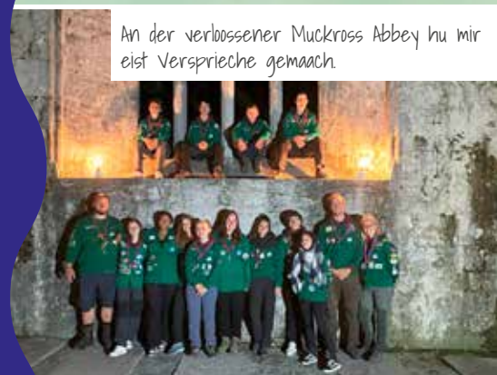
An der verlossener Muckross Abbey hu mir eist Versprieche gemaach.