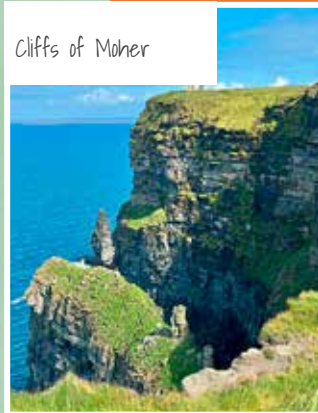
Cliffs of Moher