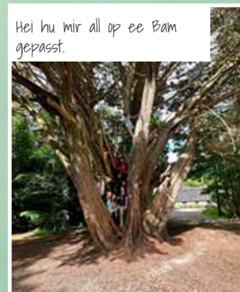
Hei hu mir all op ee Bam gepasst.