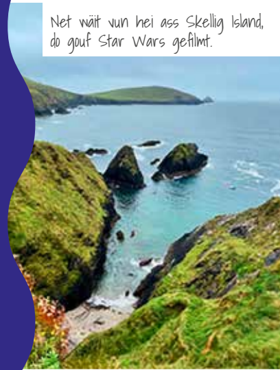
Net wäit vun hei ass Skellig Island, do gouf Star Wars gefilmt.