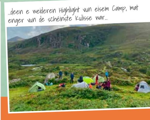
...deen e weideren Highlight vun eisem Camp, mat enger vun de schéinsten Kulisse war...