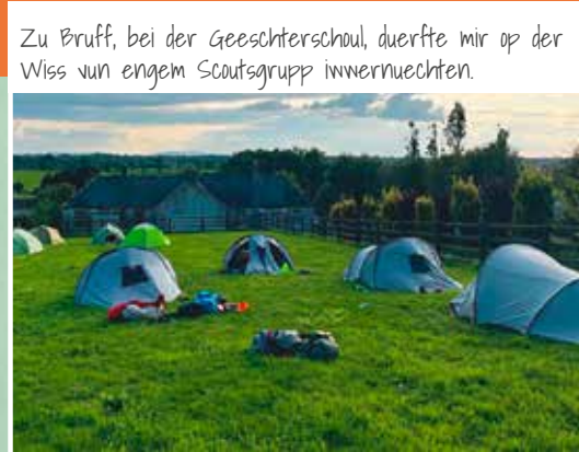
Zu Bruff, bei der Geeschterschoul, duerfte mir op der Wiss vun engem Scoutsgrupp innernuechten.